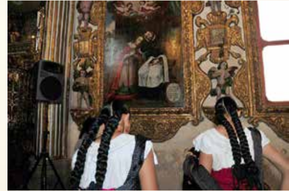
Capilla del Santo Cristo de Tlacolula. Tlacolula de Matamoros Oaxaca.