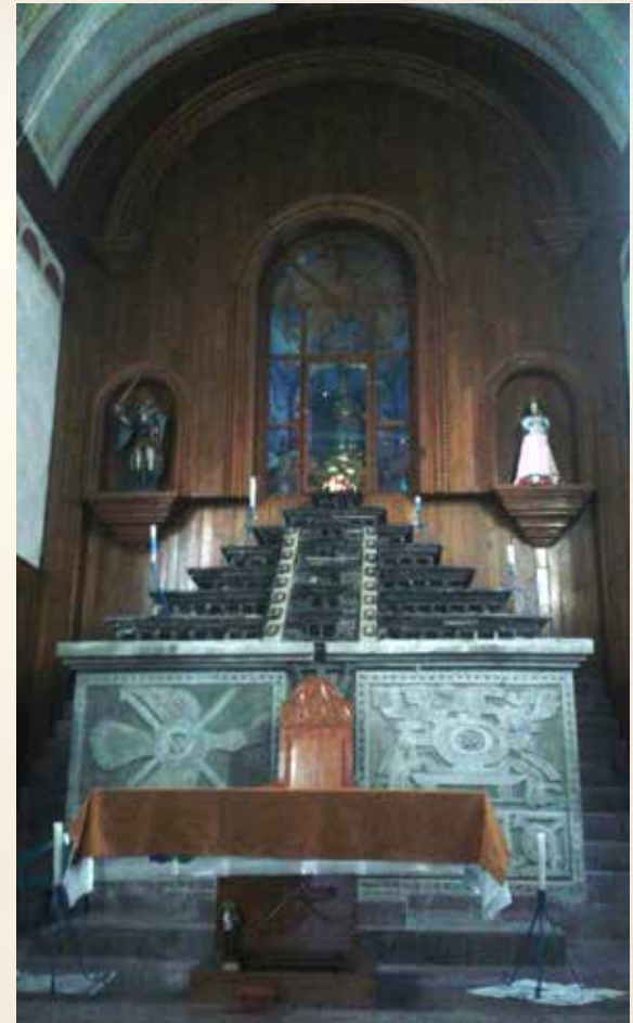
Templo parroquial de San Salvador, Huehuetla Puebla. Imagen. Mitzi de Lara

Así, para la sociedad, la identidad es una construcción social, donde el patrimonio se conforma por los acontecimientos memorables y memorizables del pasado, "... hechos sociales. Interpretan la historia en el sentido que le dio el grupo que lo produjo." (Avilés 83-84) El sentido se adquiere mediante un proceso de patrimonialización, es decir, "... cuando el Estado interviene con una serie de operaciones