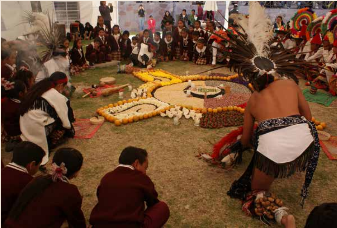
Tonantsin tlali: Fiesta de la Identidad en honor a nuestra madre tierra.

El contexto en el que se desarrollan estas interacciones muestra un escenario diferente al que relata Jorge Fernández Gonzalo en su obra Filosofía zombi . Los zombis en este caso aún son minoría; es posible pensar que la mordida de la industria del ocio todavía no esparce el virus que invade a la sociedad hipercodificada. Es por eso que, bajo el ejercicio y reflexión desde la interculturalidad, se busca evidenciar, cuestionar y plantear posibilidades a los excesos del consumo del mundo zombificado.