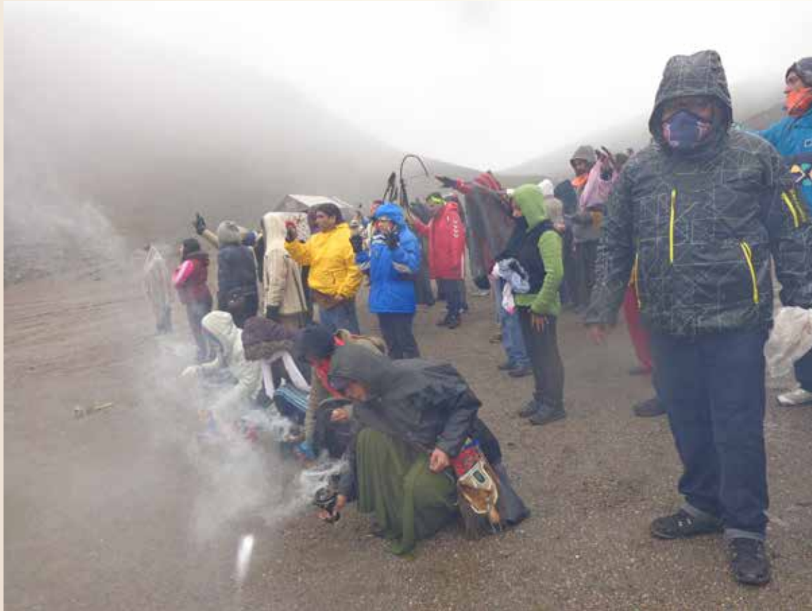
◀ Trujillo, Verónica. Ofrenda al Xinantekatl. 2013. Fotografía. México.

de las diferentes comunidades con las cuales se trabaja. (Fernández Collado 63) De esta forma, los partícipes crean nuevas relaciones, consolidan amistades e inclusive aprenden/enseñan bajo su particular urdimbre de conocimientos.