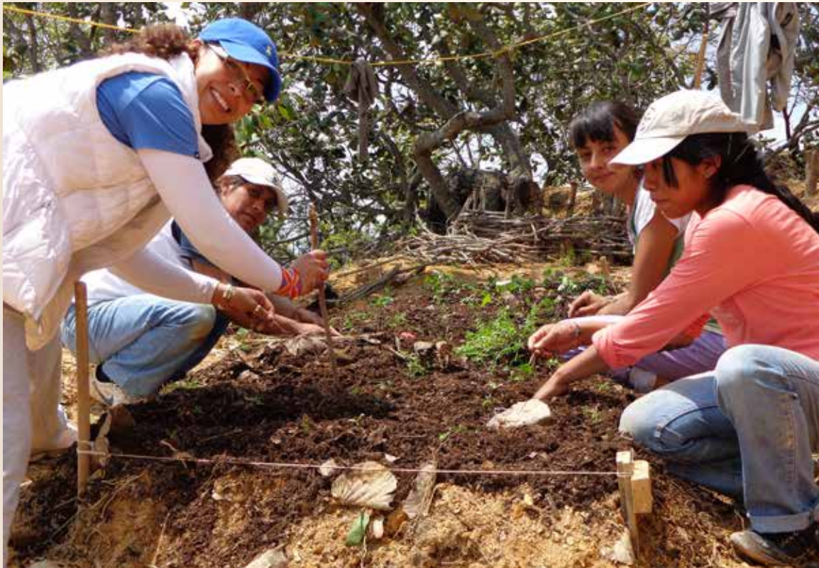
Trujillo, Verónica. Tekio. 2014. Fotografía. México.

Descrito lo anterior, es fácil visualizar cómo gracias al uso alterno y activo de los medios digitales se da cuenta de otro agrupamiento social promovido por estas inteligencias colectivas: los espacios de afinidad. (Dussel 19-21) Dentro de estos ambientes desarrollados por las Fiestas de la Identidad, los participantes tienen en común una tarea, la cual puede ir desde compartir un mensaje, discutirlo o crear acuerdos en torno a él, hasta realizar una danza, ceremonia, temaskali o velación. Para ello es frecuente observar cómo desde el diálogo mutuo y voluntario se coordinan actividades entre estudiantes, egresados, docentes y gente de la comunidad, sin importar edades, géneros o sectores sociales.