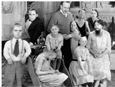
Imagen 7. Staff de un freak show.

Como ejemplo actual, se encuentra el caso de Valeria Lukyanova, quien gracias a la mezcla de técnicas de maquillaje, el entrenamiento físico y la cirugía estética, se ha convertido en la Barbie humana y ha rebasado la belleza artificial de la muñeca.