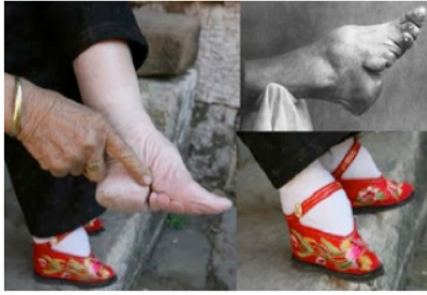
Imagen 1. Pie de loto.