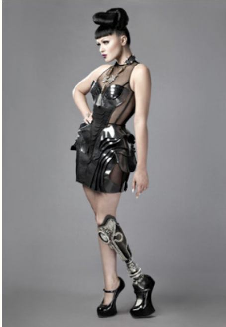
Imagen 10. Viktoria Modesta.

cuerpo, para romper los paradigmas formados desde tiempos inmemorables y que delimitan a las personas amputadas o discapacitadas a simples cargas sociales; convirtiéndose en una revolucionaria anti-sistema, que utiliza como estandarte un reemplazo robótico que la muestra más fuerte y más capaz, lo que hace que en un mundo casi real, incapaz de comprenderlo, sea condenada por esta afrenta.