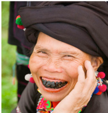
Imagen 2. Mujer Batak.

Alternativa que plantea un nuevo panorama: la incursión de las personas discapacitadas no solo como miembros funcionales de la sociedad, sino también como íconos de belleza o ¿postbelleza?