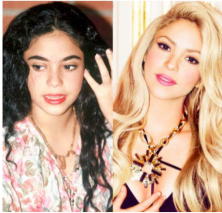
Imagen 5. La cantante Shakira antes y después de ser famosa

última tecnología, la cual no discriminó entre la industria farmacéutica y de la belleza; ambas merecían ser atendidas pues eran económicamente redituables y manipulables.