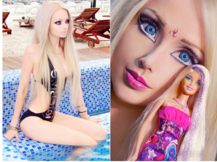
Imagen 6. Valeria Lukyanova, la Barbie humana.