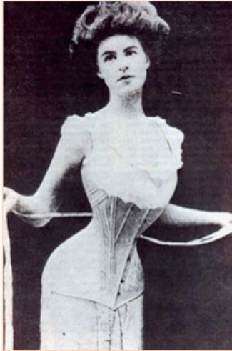
Imagen 3. Silueta "S".