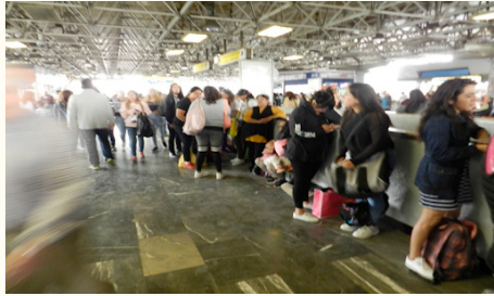
Fotografía tomada en la estación Chabacano, L-2.