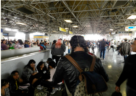
Fotografía tomada en la estación Chabacano, L-2.

también sobre el tiempo que se dedica a los intercambios desde el momento que suben fotos a Facebook y, después de esto, las mujeres comienzan una relación más personal y directa con las otras mujeres que van a ver para posiblemente intercambiar.