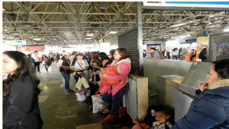
Fotografía tomada en la estación Chabacano, L-2.

prácticas culturales y modos de comunicación. Específicamente la comunicación simbólica en esta semiosfera femenina conduce a un intercambio cuyo objetivo latente es transmitir la información del trueque y que, en el proceso de construcción de ese espacio femenino, se reproduce una reconstrucción del lenguaje del intercambio y del nuevo uso de productos.