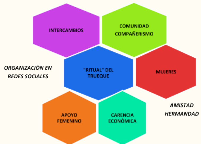
Lámina 3. Ejemplifica la práctica del trueque de una semiosfera femenina en el metro Chabacano, donde se aprecian los comportamientos de consumo del trueque y/o los intercambios, en donde las conductas son para beneficio de las integrantes de dicho grupo (s) y la organización (en Facebook) es la principal promotora de las actuaciones de comunidad y compañerismo entre las mujeres que se conocen, se apoyan económica y solidariamente.

Además, se vislumbra que existe un valor no solo monetario en las mercancías y/o productos que se intercambian los sábados en el metro Chabacano. Porque el valor del producto se entiende como una disposición a continuar la vida útil de una mercancía. Así, el trueque, su lenguaje y poder cultural en Chabacano es comprendido por estas mujeres como una práctica social por: gusto, necesidad, comodidad, compromiso; desde el punto de vista de la obtención de algo bueno a cambio de dinero y/o de otro producto. En esta semiosfera surgen pactos textuales entre el emisor y el receptor; tiende a la expansión, a la semiosis, con nuevos significados y con una construcción en cadena.