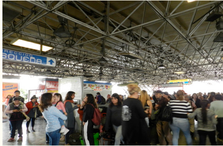
Fotografía tomada en la estación Chabacano, L-2.