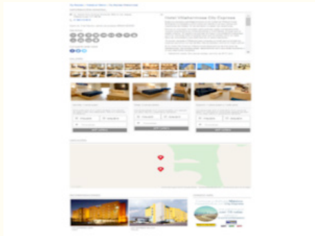
Imagen 3. Estructura argumentativa compuesta por texto e imagen.

de los lugares comunes. Puntualizando y de acuerdo a esta definición, es la parte donde se ofrecen datos concretos que le serán de utilidad tanto al diseñador de la página como a quien estructure el contenido del discurso publicitario, para convencer o en su caso entrar por el lado sensible hacia el receptor y así conectarse emocionalmente con él.