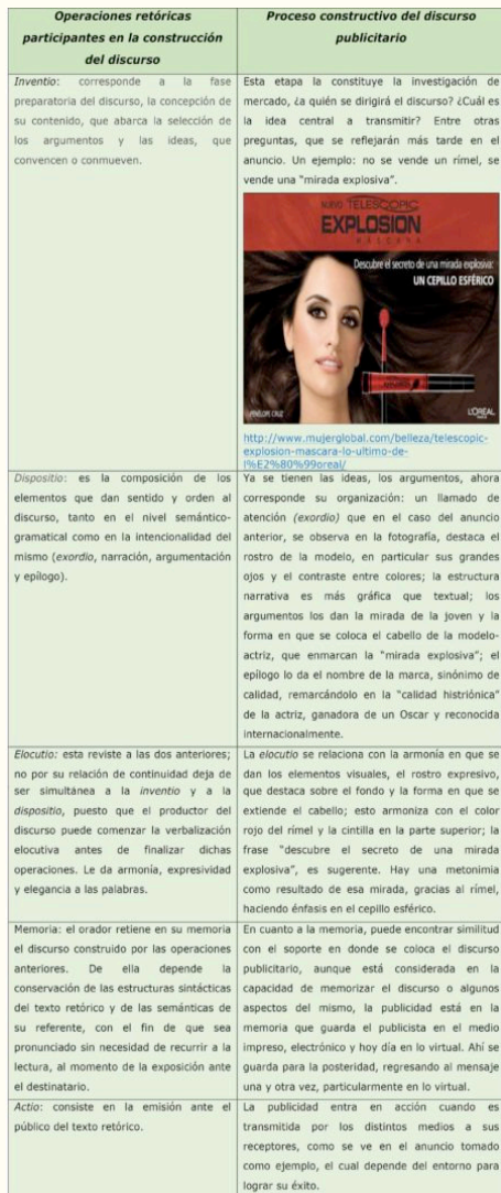
Tabla 1- Correlación entre las distintas operaciones retóricas y su paralelismo publicitario, autoría propia

insistido sobre las figuras retóricas; los primeros estudios estuvieron basados en el texto lingüístico y hay que recordar que la publicidad masiva se dio primeramente en lo impreso. Ha sido a partir del recurso de la imagen, que han proliferado trabajos de análisis, también desde la perspectiva de la tercera operación retórica.