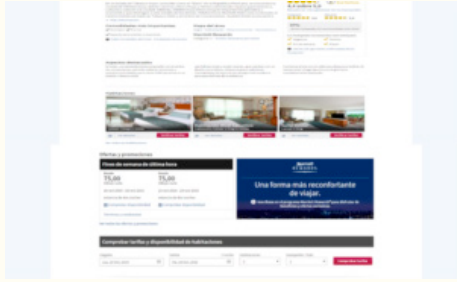
Imagen 2. Estructura narrativa de las home page son en forma modular.

digresión, clara, verosímil y estimulante. No todas esas características se cumplen en los hoteles, ya que algunos pueden tener cinco, otros tres o menos.