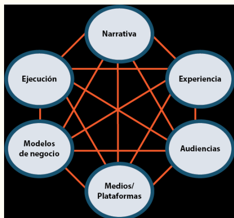
Imagen 5. Áreas de un Proyecto Transmedia. Fuente: Carlos Alberto Scolari . (2013).

Experiencia: cuando se realiza una narrativa transmedia lo que se diseña es una experiencia. (Scolari 2013 117-118) Algunas preguntas que pueden ayudar al diseño de la experiencia es pensar en ¿qué tipo de participación buscamos?, ¿cómo se gestionará la participación de los consumidores?, ¿queremos que la experiencia quede limitada a medios y plataformas o queremos que se extienda también al mundo real? En el caso del documental transmedia, dentro de las producciones Malvinas 30 y Proyecto Walsh, ambos dirigidos por Álvaro Liuzzi, se buscó la expansión de la experiencia al mundo real por medio de Twitter, ya que este servía para informar en tiempo real sobre los sucesos que se discutían en la NT.