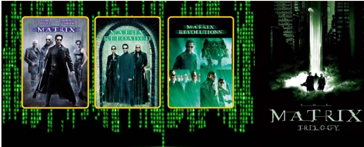
Imagen 1. Trilogía de películas "The Matrix".

narrativo, de acuerdo con la plataforma elegida, y además permite que el espectador que haya consumido todos los productos tenga una idea completa y profunda de la historia. Sin embargo, cada producto es independiente y genera un acceso a la narrativa como un posible todo.