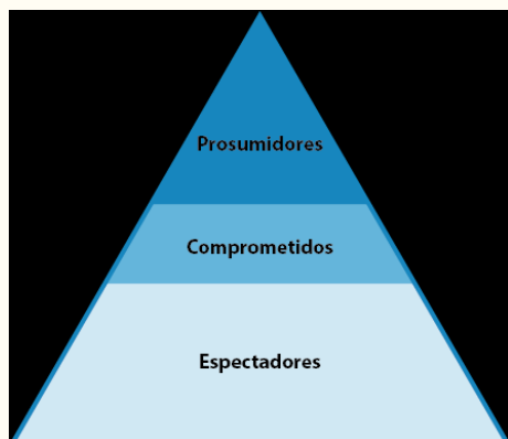
Imagen 6. Pirámide sobre tipos de audiencias.

dispositivos. Asimismo, el nivel de profundidad con que cada usuario se sumerge en el relato permite conocer diversos aspectos sobre el universo narrativo planteado, de esa manera se genera una experiencia propia.