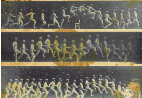
Imagen 3. Los experimentos fotográficos de Jules Marey.

de fantasía?, ¿pueden los productos de no ficción introducirse en este tipo de narrativa? Preguntas como estas serán contestadas a lo largo de este apartado.