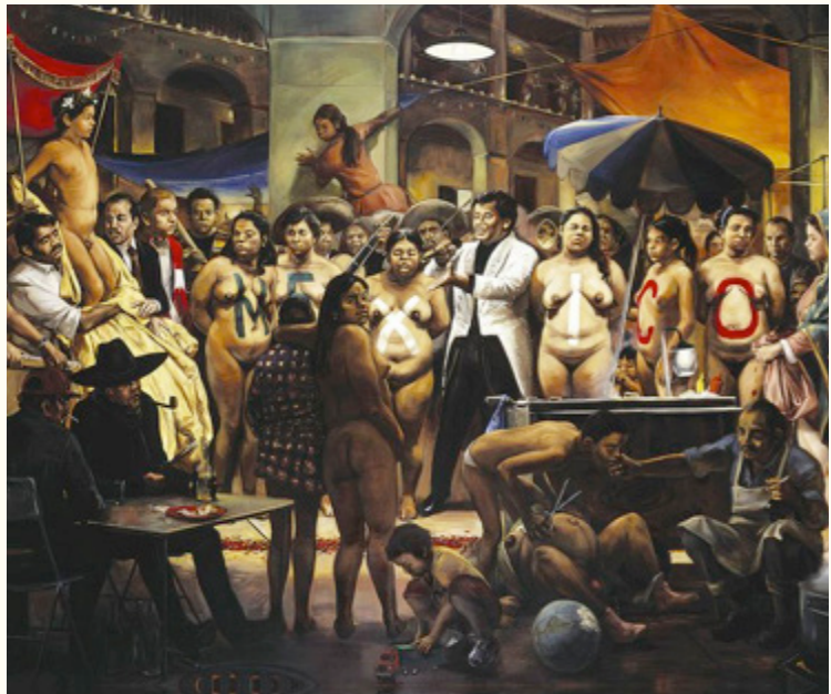
Lezama, Daniel. La gran noche mexicana. Colección Gunter Robde, Puebla.

el usuario podrá reconocer e interpretar diferentes elementos que pueden evocarlo a situaciones, algunas cotidianas y otras que, pueden generar molestia o malestar a partir de su representación.