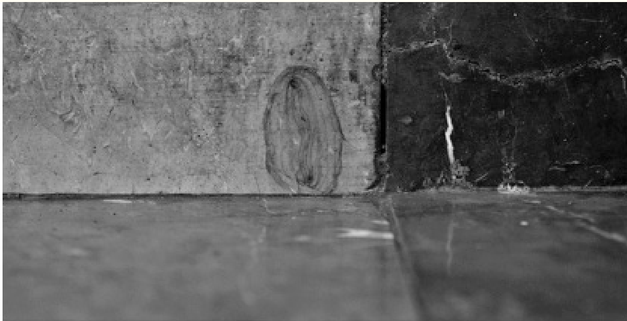
Imagen 1. La virgen del metro. En el metro Hidalgo de la ciudad de México se encuentra la representación icónica y social de la denominada Virgen de Guadalupe, en donde día con día miles de fieles la veneran con oraciones y flores.

Lo simbólico se genera a partir de la profundidad, en la que la imagen es posicionada ante la sociedad y en que tan arraigado se encuentra el significado colectivo de la imagen y su representación. Un ejemplo muy burdo pero característico es la figura de la Virgen del Metro (estación Hidalgo en 1997) que se desprende de la Guadalupana, donde lo relevante no es la representación fiel a la que se encuentra en el ayate de Juan Diego, sino en su valor simbólico (ver imagen 1)