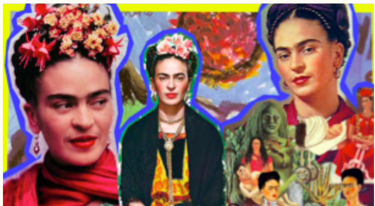
Imagen 2. La Imagen de Frida Kahlo puede ser uno de los ejemplos de horizonte cultural, la cual a través de los años ha ido cambiando y expandiendo su significado, en un principio fue la historia de su vida, posteriormente su obra, a finales del siglo pasado fue plasmada como nuevo símbolo mexicano que incluso en estos días es considerada como una parte fundamental de México

Competencias icónicas: Apremiar y experimentar, significar y valorar, es decir, iconizar una imagen, no es un acto espontáneo, ajeno a toda socialización, resultante de una