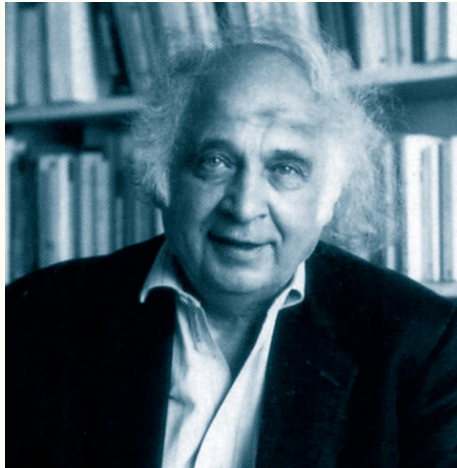
Serge Moscovici.