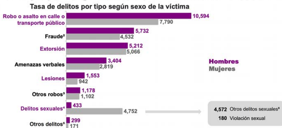
Imagen 1. Gráficas de Encuesta de Victimización y Percepción sobre seguridad pública de la INEGI 2020. Captura de Pantalla 06/03/21

Lagarde comenta que el principio fundante del feminismo se basa en la aceptación de que las mujeres y los hombres no son iguales, sino que, por el contrario, poseen diferencias significativas. Pero que, aun siendo desiguales, tienen el mismo valor. Pero, ¿las mujeres son consideradas como seres de igual valor ante la sociedad? Eso habría que cotejar en los delitos reportados para cada grupo. Específicamente en México, con respecto de las víctimas de delito se reporta lo siguiente: