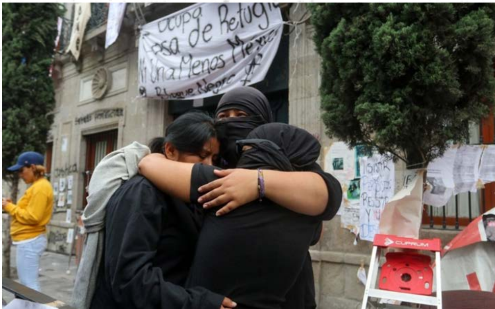
Imagen 4: Foto tomada por Andrea Murcia/Cuartoscuro 25/02/21

El ejemplo más reciente del anarco feminismo en México fue la toma de la sede de la Comisión Nacional de los Derechos Humanos (CNDH) por parte de colectivas feministas el 2 de septiembre del 2020, como protesta a la presunta violación a una menor de edad en una escuela privada de San Luis Potosí.